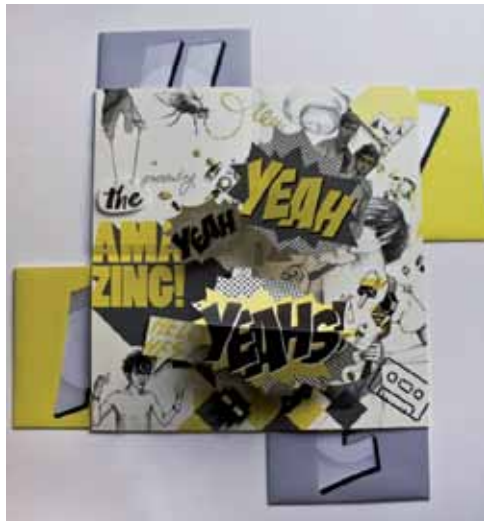
Vinylplatten-Verpackung – Sabine Teubner

vielen Vorstellungsgespräche, die die Absolventen direkt nach der Abschlusspräsentation mit führenden Werbeagenturen aus dem Großraum München führten. Impressionen unter: http://www.youtube.com/watch?v=HNDjHhA3bxY