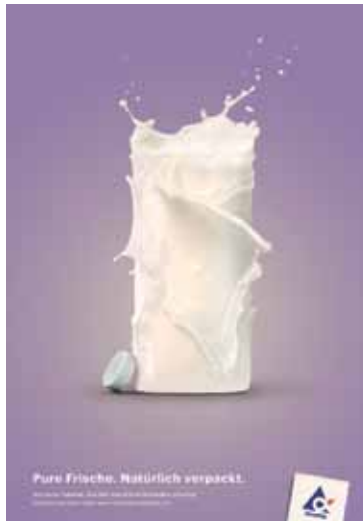
Tetrapak Werbekampagne – Roman Burger