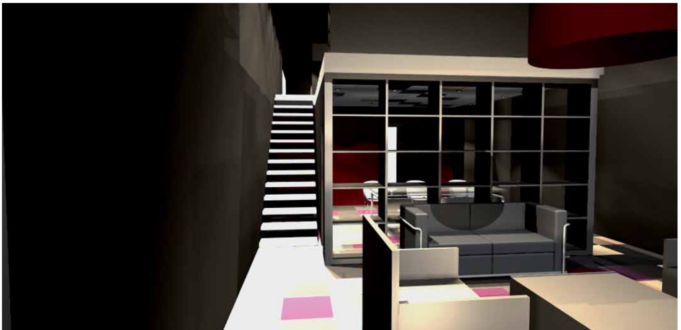
Perspektive - Stella Mo