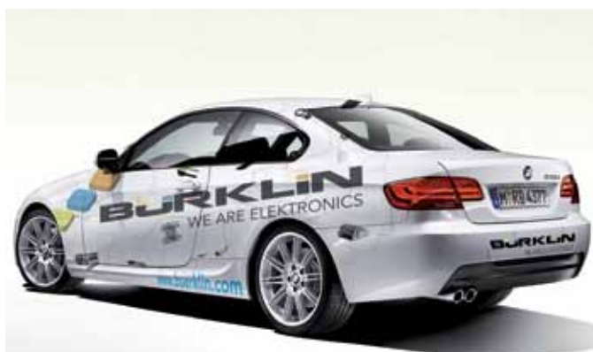
Corporate Design - Julien Kneuse